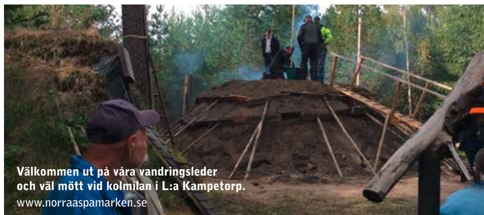
Välkommen ut på våra vandringsleder och väl mött vid kolmila i L:a Kampetorp. www.norraasparamarken.se