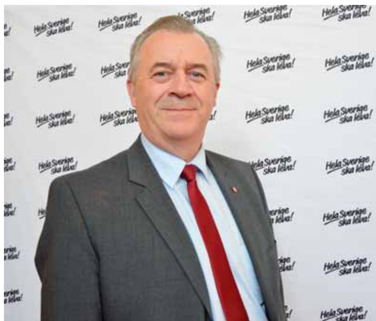
Sven-Erik Bucht fotografad på Landsbygdsriksdagen på Gotland.