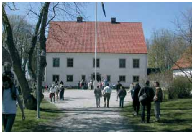
Vamlingbo prästgård, ett av Gotlands populäraste besöksmål.

Burgsviken är en stor grund vik som helt enkelt kollapsat, som Jan uttrycker det. Under besöket får deltagarna vet mer om det stora miljöprojekt som pågår för att återställa viken.