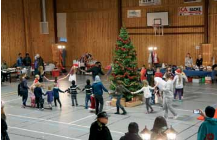
Julmarknad i Backe, med dans runt granen.