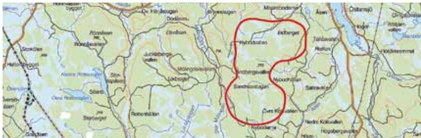
På bilden är Åndberget inringat, det område där verken ska placeras. Det ligger cirka 2,5 mil söder om Lillhärdal.

I Lillhärdal, Härjedalens kommun, finns nu ett avtal mellan bygden och två olika projektörer om återbäring från kommande vindkraftsproduktion på en procent av bruttoersättningen. Det kommer att ge cirka 10 miljoner kronor per år i 40 år till bygden.