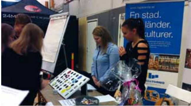
Ungdomar från projektet Ung i Tornedalen på mässan Växa i Kalix.