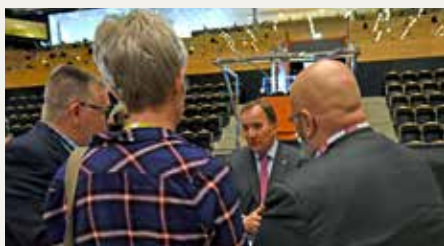
Statsministern omgiven av reportrar efter politikerdialogen