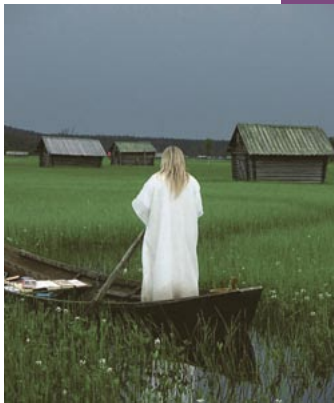
Försommarmattens festival på myren är en helhetsupplevelse av människa, natur och kultur.

År 1994 bildade fyra byar runt myren en gemensam utvecklingsgrupp, MEJA. Byarna är Mukkakangas, Erkheikki, Juhonpieti och Autio. Syftet var att vitalisera bygden och skapa nya, bestående arbetstillfällen. Ett av målen för detta var återupptagen hävd av Vasikkavuoma. I samverkan med Länsstyrelsen svarar MEJA i dag för slätter av cirka 25 hektar. En mindre del slås för hand med lie. I övrigt sker det med en specialkonstruerad slättermaskin som kan gå både i vatten och på land. Denna, i praktiken en slätterbalk med vassklippare, har tagits fram i samarbete mellan MEJA och ett litet maskinföretag i Dorotea i Västerbottens län. MEJA kan även åta sig maskinslätter utanför Vasikkavuoma. Allt som slås blir renfoder. Det som inte används av medlemmarna i MEJA säljs, och samverkan med samebyarna i omgivningen fungerar väl. Ett åttiotal lador har restaurerats. Föreningen har ett brett nätverk och flera avknoppade verksamheter, bland annat camping och naturskola och samverkan med olika företag. För att ytterligare förstärka om-