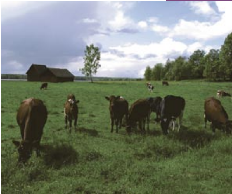
Kalvar på bete i Svartådalens. Böndernas satsning på naturbeteskött gynnar kulturlandskapet.

Svartådalens bygdeutveckling, ekonomisk förening, bildad 2002, är egentligen inte en lokal utvecklingsgrupp eller förening utan mer av både nav och motor för en lång rad aktiviteter, projekt, föreningar och företag. Huvudsyftet är att främja en positiv utveckling av service och näringsliv i bygden, inte minst natur- och kulturturism. Det särpräglade kulturlandskapet är nödvändigt i sammanhanget. Ett tjugotal lador har rustats upp, man erbjuder vandringar i landskapet och fågelskådning, medlemmarna skyltar upp sevärdheter, anordnar föreläsningar och