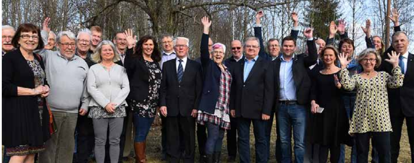
Deltagarna på Länsbygderådet i Örebro läns årsmöte.