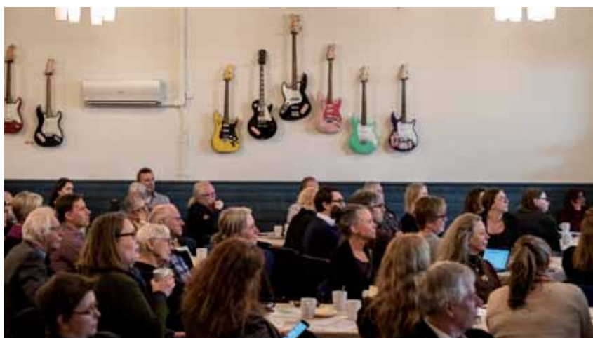
Djup koncentration på Landsbygdstinget.