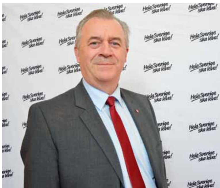
Sven-Erik Bucht fotografierad på Landsbygdsriksdagen på Gotland.