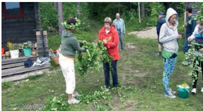
Midsommarfirande.

– Alla är nog stolta över att vi regelbundet upprätthåller badplatsen och kulturvandringsleden. Byastugan är också i bra skick och det möjliggör att vi kan fortsätta med föreningens arbete.