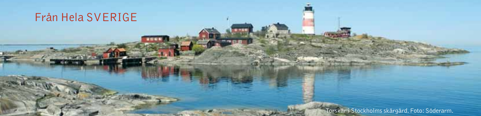
Torskär i Stockholms skärgård.