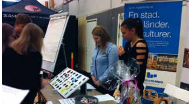
Ungdomar från projektet Ung i Tornedalen på mässan Växa i Kalix.